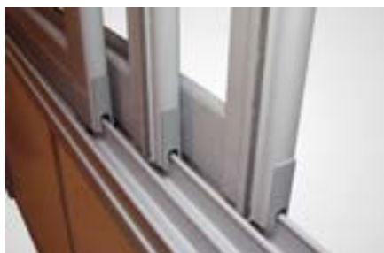
Mjukt rundade profiler med dubbla tätningar mellan luckorna.