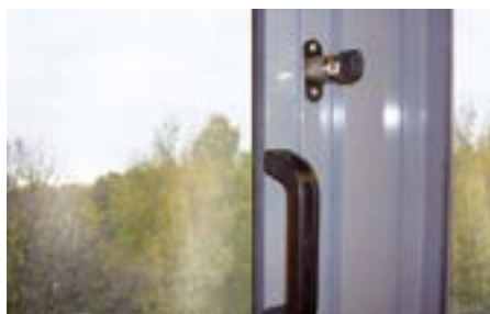
Möjlighet till låsbar inglasning.