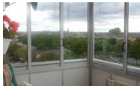
Skjutluckor som enkelt öppnas.